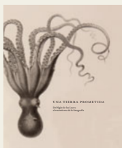
UNA TIERRA PROMETIDA. DEL SIGLO DE LAS LUCES AL NACIMIENTO DE LA FOTOGRAFÍA