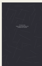
CREACIÓN, IRATXE ANSA & IGOR BACOVICH. CUADERNO DE CREACIÓN