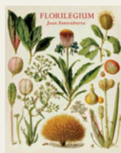
FLORILEGIUM JOAN FONTCUBERTA