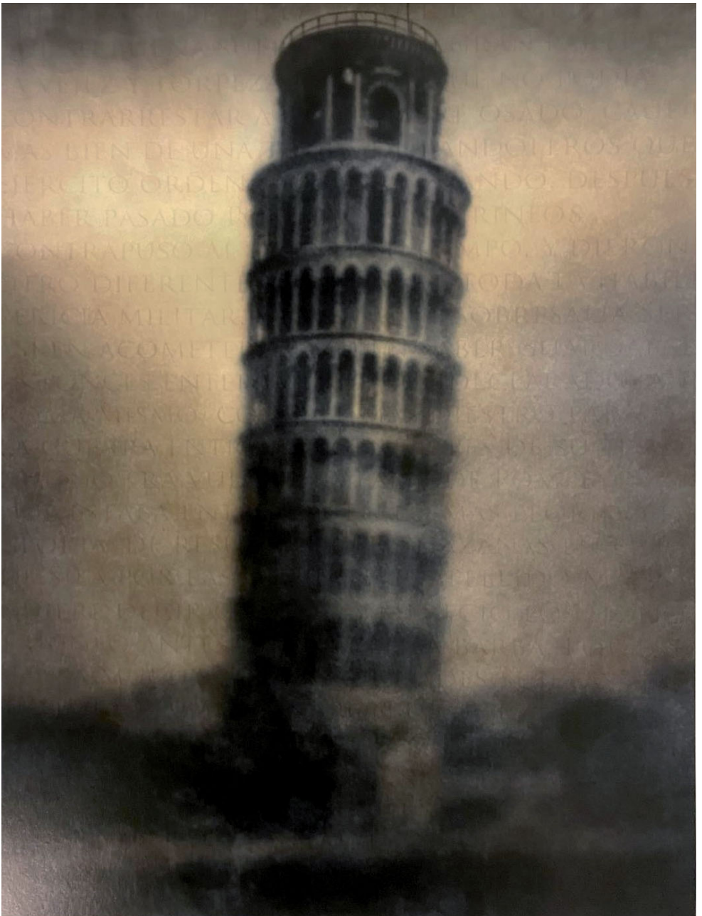
SIN TÍTULO, 2002. RAFAEL LEVENFELD