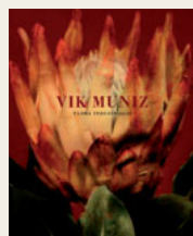
VIK MUNIZ. FLORA INDUSTRIALIS