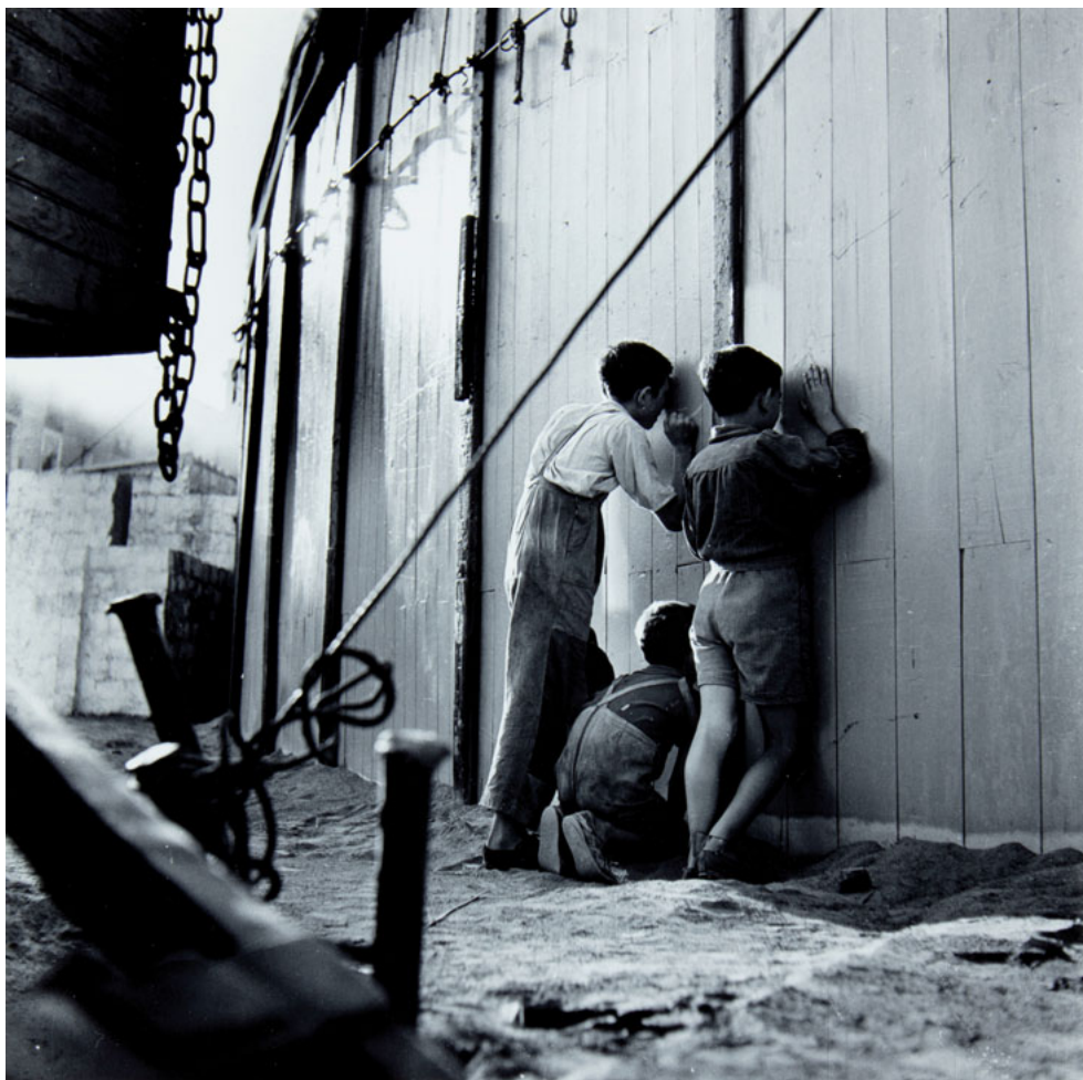
CIRCO. BARCELONA, 1952, CATALÀ ROCA