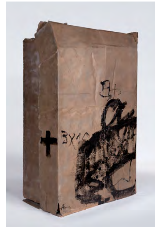
COMPOSICIÓ AMB CISTELLA