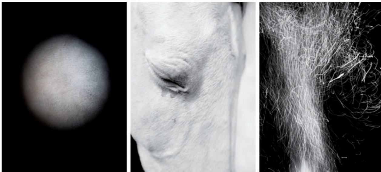
AURA. TRÍPTICO PELO-CABALLO-FUEGO, 2018

su manera de trabajar, no solo en lo relacionado con la técnica fotográfica, sino también en cuanto al modo de elaborar y construir las imágenes, hasta darles una forma final. Explora los límites de la representación y del lenguaje fotográfico, al que aleja de la literalidad, acercándolo al territorio de lo intangible. La propuesta del autor no es documental ni narrativa: sus fotografías están desvinculadas de un espacio y un tiempo.