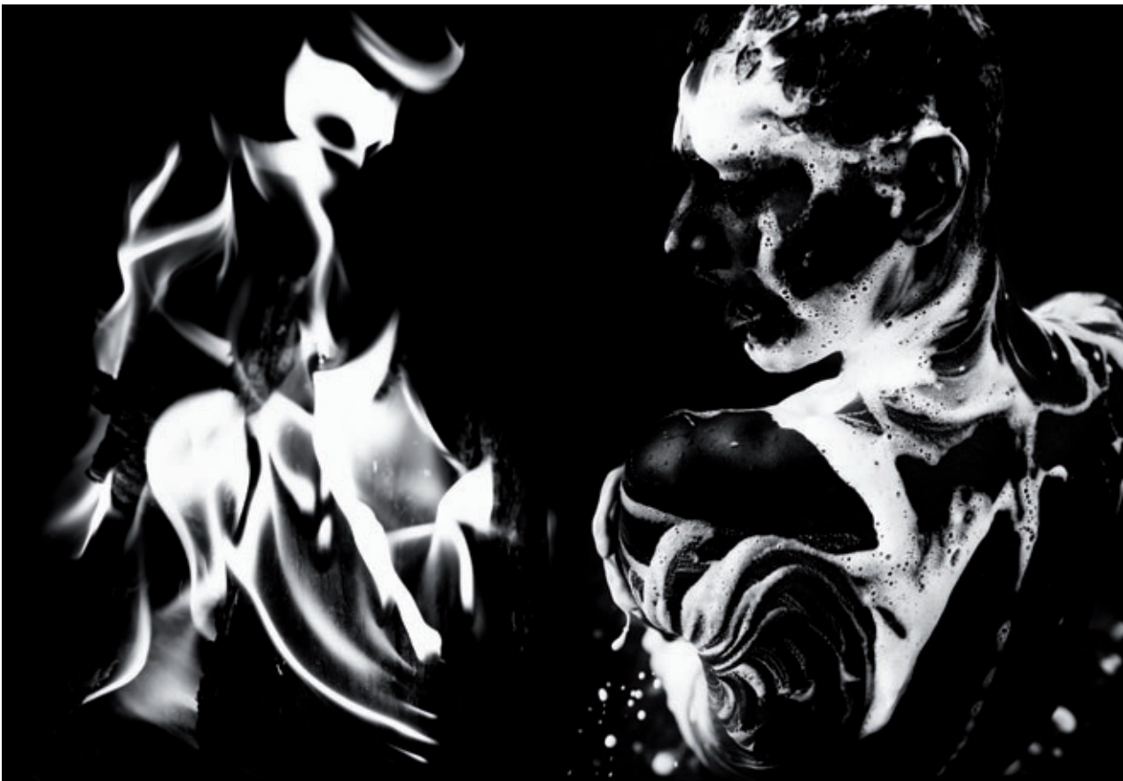
AURA. DÍPTICO Nº 239, 2018

and exploration of the different ways the images can be combined. In this exhibition, ROMA and Aura are displayed in two wings of the same space, so the images can come face to face and interrelate. Versus occupies the Sala Torre, which also features materials the artist used to prepare the work in the form of a photobook.