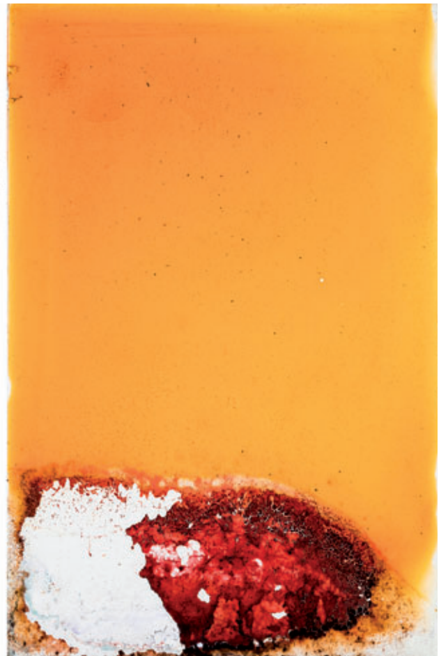
ROMA. DÍPTICO Nº 23, 2017

David Jiménez not only attempts to establish a network of visual and semantic relationships within the multiple-image pieces, but also seeks to create relationships among the various pieces that make up the project (individual images, diptychs, triptychs, projections), thereby weaving a subtle web of mutual dependence. Each individual piece overflows with meaning, but is also enriched by its relationship with the other pieces – not as a fixed proposal, but as a universe where viewers are free to establish their own rules. These links are enhanced by connections between different projects in the same room, where the viewer transitions from ROMA to Aura .