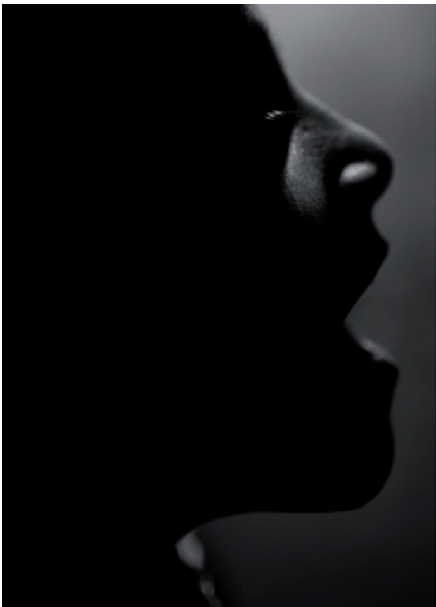
AURA. DÍPTICO Nº 168, 2018