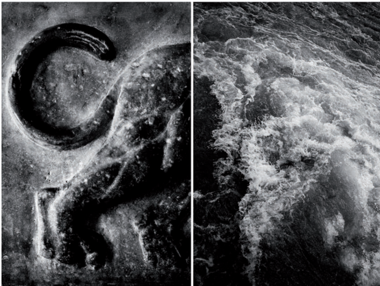
ROMA. DÍPTICO Nº 35, 2017

La exposición Universos del fotógrafo David Jiménez recoge lo esencial de distintos proyectos realizados a lo largo de toda su carrera artística. Concebida como un todo orgánico, es el resultado de la revisión de un corpus fotográfico construido a lo largo de más de 25 años. Universos parte de la decisión del artista de experimentar con su trabajo, explorando los límites de la representación y los diversos modos en que las imágenes se relacionan entre sí, conjurando su capacidad para la generación de nuevos significados, apostando por esta vía como una forma de percepción y conocimiento de la realidad desvinculados de lo racional.