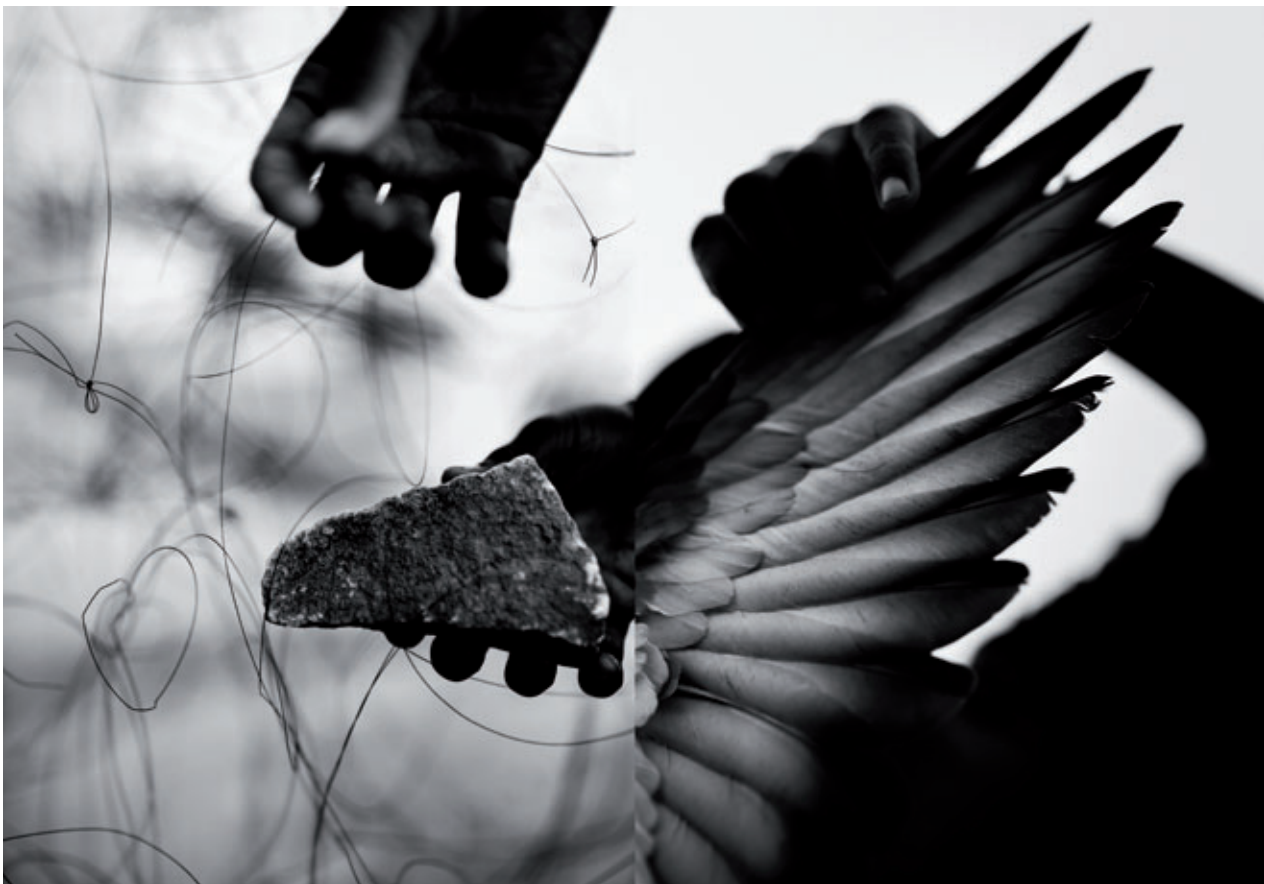
AURA. DÍPTICO Nº 119, 2016

La propuesta de David Jiménez de establecer una red de relaciones visuales y semánticas se extiende, más allá de las piezas múltiples, a la posibilidad de establecer relaciones entre las distintas piezas que conforman el proyecto -individuales, dípticos, trípticos, proyecciones-, tejiéndose de este modo una sutil red de interdependencias. Cada una de las piezas contiene una gran densidad de significado por sí misma, pero al mismo tiempo se enriquece en su relación con el resto, no como una propuesta cerrada sino dando lugar a un universo en el que cada espectador puede establecer sus propias reglas. Estos vínculos se enriquecen al relacionarse distintos proyectos en una misma sala, en la que transitamos del espacio de ROMA al de Aura .