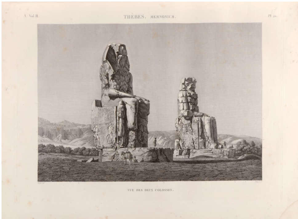
DESCRIPTION DE L'ÉGYPTÉ,

ESTE PROGRAMA REALIZA UN RECORRIDO POR LA HISTORIA DE EGIPTO A TRAVÉS DE LA CAMPAÑA DE NAPOLEÓN Y LOS LIBROS DE CHAMPOLLION.