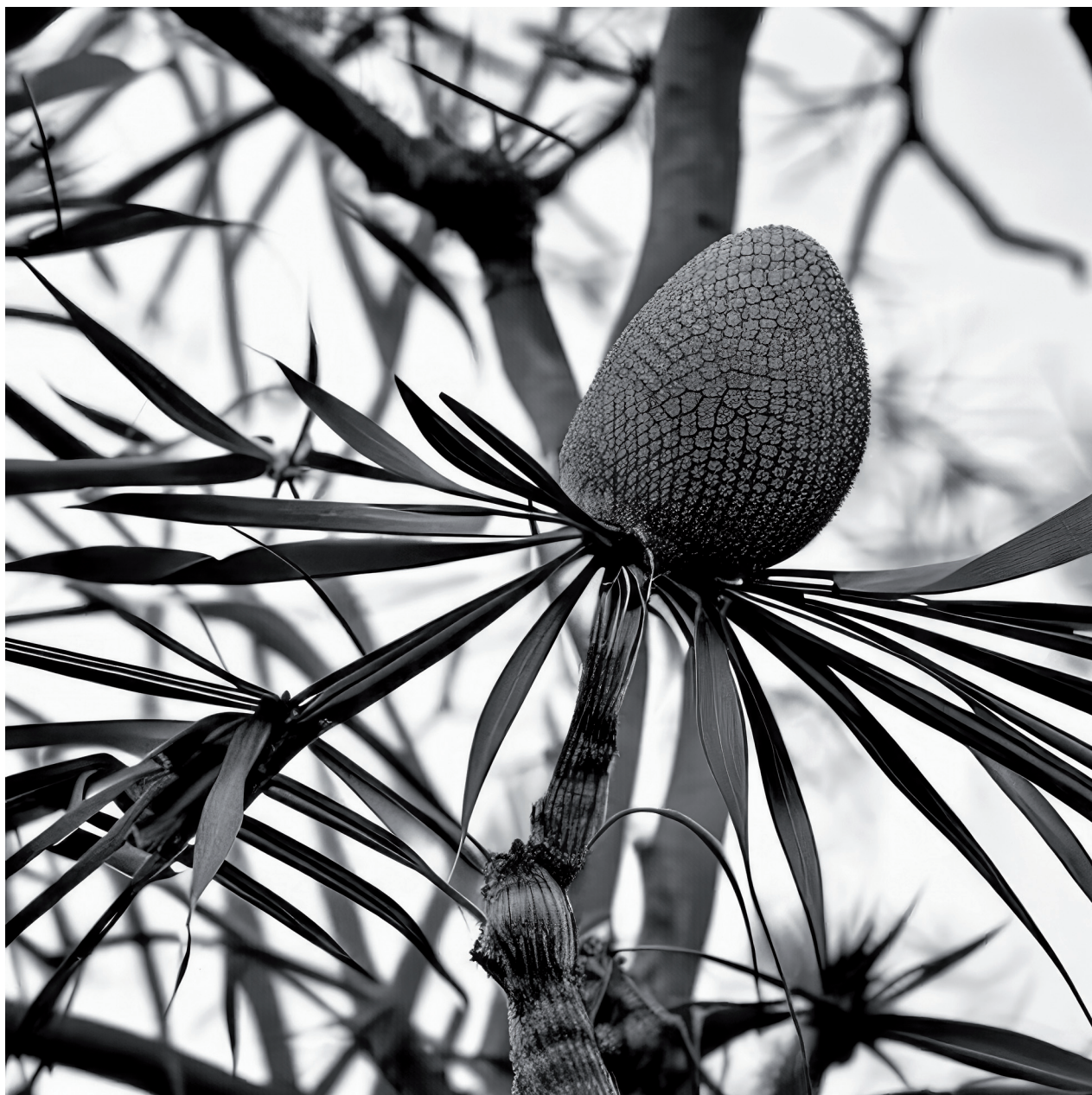
CALYPTUS ABURENDIS. • JOAN FONTCUBERTA, VEGAP, PAMPLONA, 2024