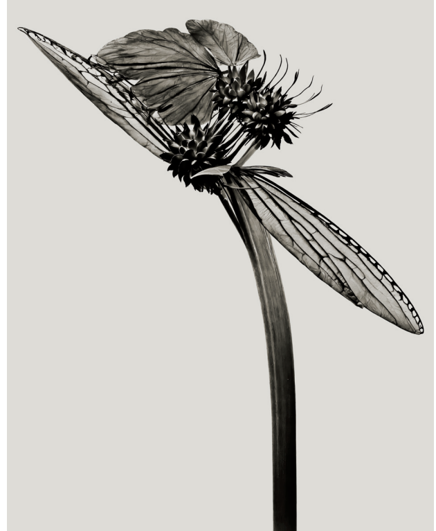
HERBARIUM GILIANDRIA / TYPHA VOLANS. © JOAN FONTCUBERTA, VEGAP, PAMPLONA, 2024

los naturalistas se hacían acompañar de pintores y dibujantes cuya misión consistía en dejar constancia gráfica de sus hallazgos: se consolidaba así la idea del artista como ojo a distancia que percibe unas realidades desconocidas y las documenta. Tanto al ojo a distancia como al documento se les exigirá la máxima exactitud descriptiva y un realismo que privilegie la precisión y el detalle. Seguro que esos artistas que “perpetraban” fotografías hechas a mano anhelaban un sistema que mejorase tales logros haciendo que la naturaleza se representase a sí misma y el resultado no dependiera de su talento o destreza. La fotografía, pues, surge de ese impulso empírico del siglo XVIII aunque su materialización, como sabemos, solo se produzca en el siglo siguiente, ya al albor de la Revolución industrial y de los grandes avances tecnológicos como el ferrocarril, el barco a vapor y el telégrafo.