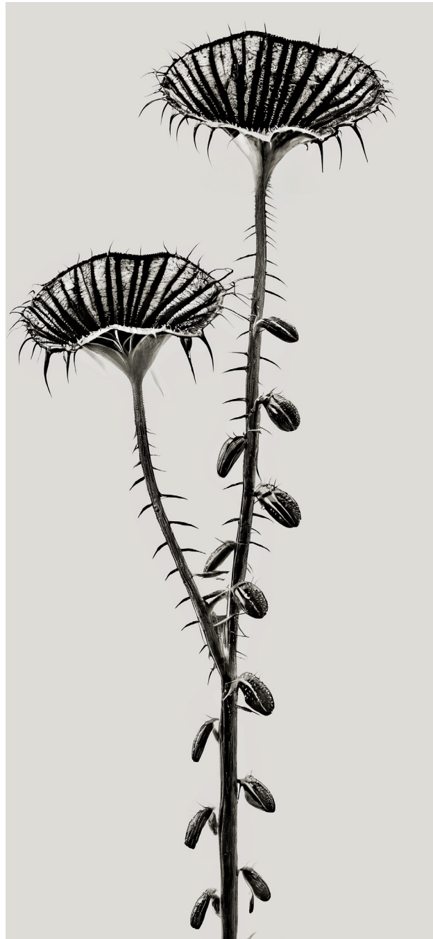
HERBARIUM BRAOHYPODA / TARAXACUM HIRSUTA.

hace falta la previsualización de una idea y saber transmitirla al sistema generativo de IA.