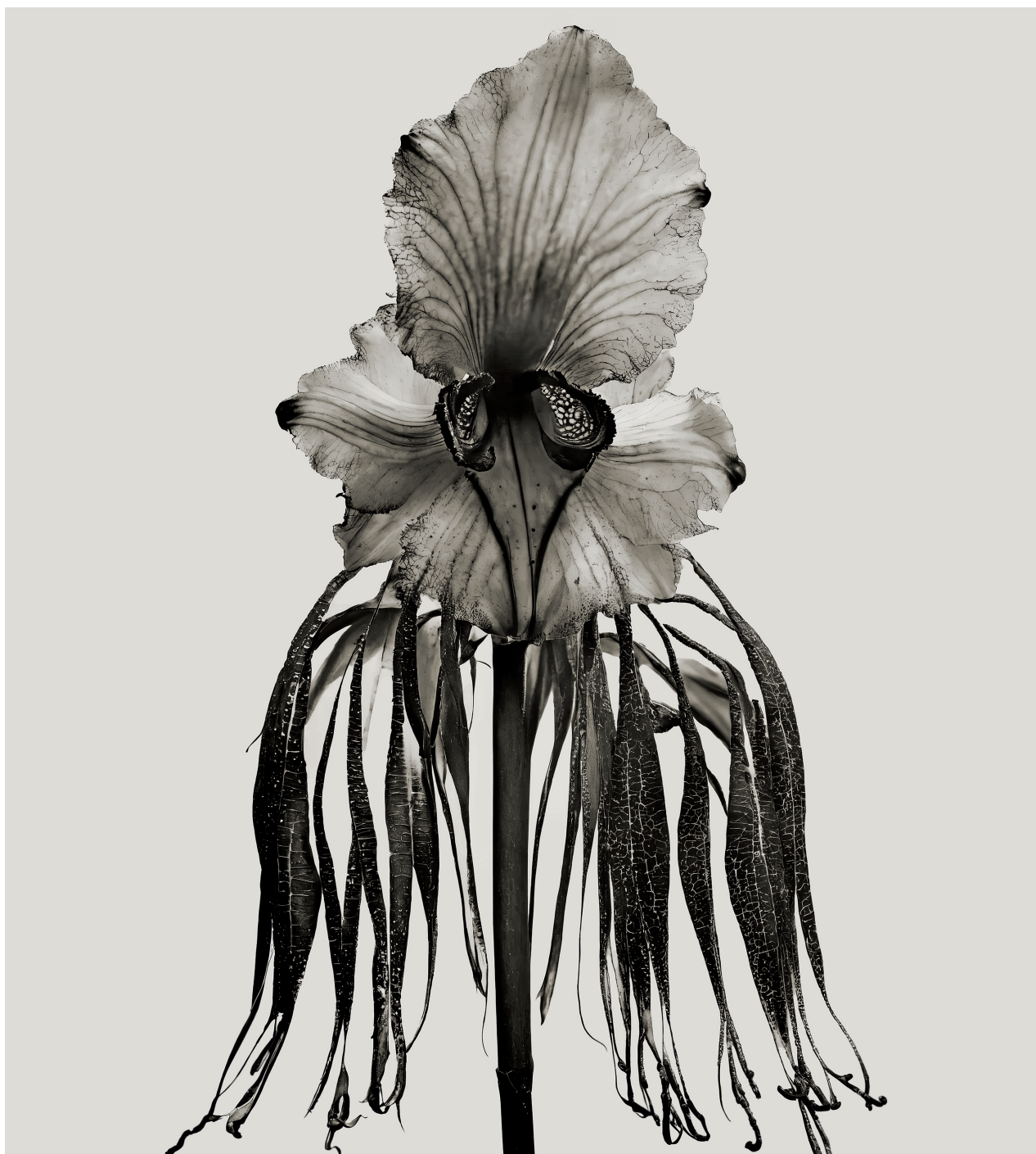
LEVENFELDA AUGUSTA. © JOAN FONTCUBERTA, VEGAP, PAMPLONA, 2024

La exposición Una tierra prometida. Del siglo de las luces al nacimiento de la fotografía sustenta la tesis de que la curiosidad científica de la Ilustración propició la necesidad de descripciones gráficas de la naturaleza lo más fidedignas posibles y tal afán prefiguró la mirada fotográfica. La cámara proporcionaba una representación fiel y detallada de los