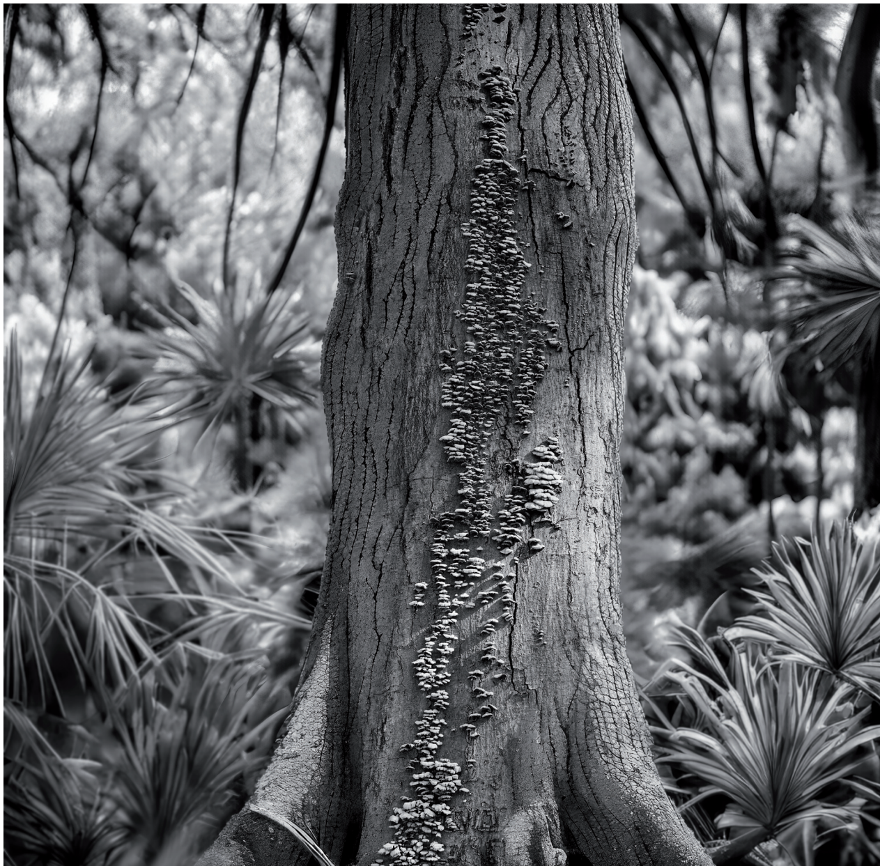
LEONTOPODIUM NIVEA & ROCHEDEA NIGRA.

ción con los polinizadores, que a menudo involucra mecanismos de engaño visual, añade un intrigante aspecto evolutivo a su estudio. Muchas imitan a los insectos que las polinizan, con estrategias muy refinadas para atraerlos. El insecto se deja seducir por lo que parece el encuentro con otro insecto del sexo opuesto. La orquídea abejera ( Ophrys apifera ), por ejemplo, luce unas rayas peludas de color marrón y amarillo, como las de la abeja hembra. La abeja macho cae en la trampa e intenta aparearse. Después marcha volando impregnada de polen y prueba suerte con la siguiente flor. Esta técnica se conoce con el nombre de pseudocopulación.