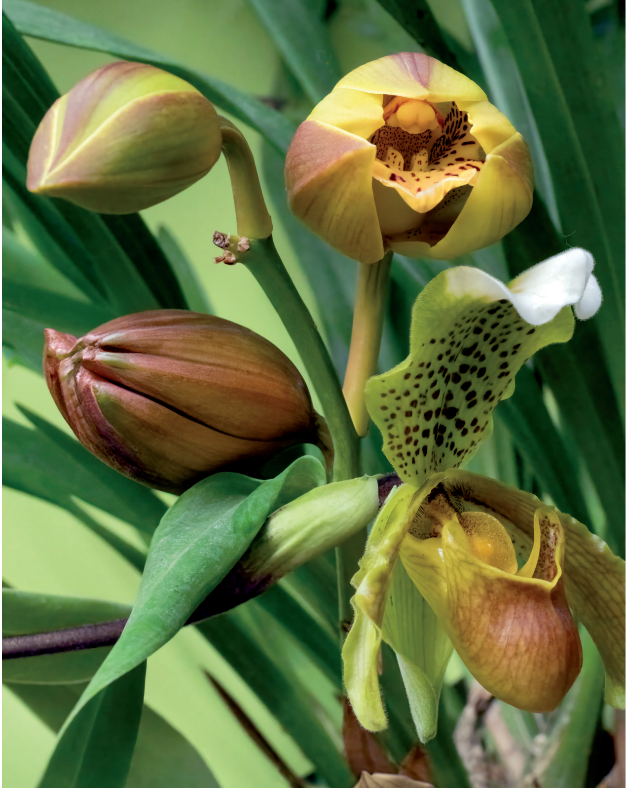
PAPHIOPEDILUM INSIGNE "MANTAS".

In a first step, Fontcuberta asks the generative programme to transform Bateman and Fitch's drawings into photographs, as if they were the result of an astonishing iconic mutation, in order to then create supposedly photographic images of orchids invented by the algorithmic fantasy. At this point, Fontcuberta subjects the viewer to the bizarre mixture of these orchids, which do not exist