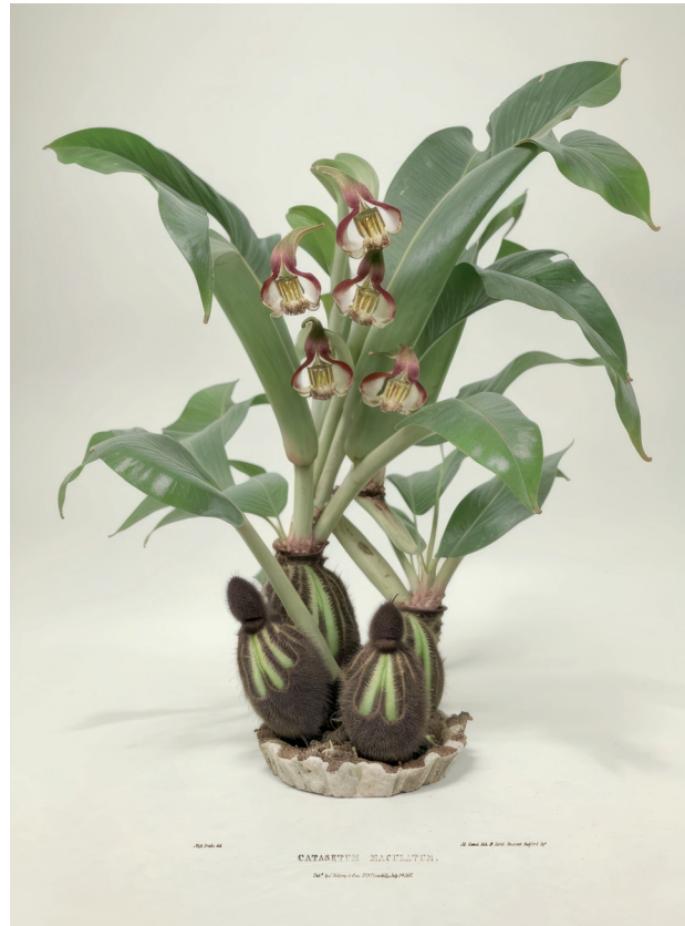
CATASETUM MACULATUM / CATASETUM MACULATUM. © JOAN FONTCUBERTA, VEGAP, PAMPLONA, 2024

- think of space travel - are trained on exhaustive preparatory information provided by telescopes, sensors, and simulations, so what they do is not so much discover as recognise, i.e. check the equivalence of previous models against their own in situ perception. But the stock of models that the conquerors, adventurers, and evangelisers of the sixteenth and seventeenth centuries took with them was full of prejudices and superstitions, which made the surprise of their collision with reality all the greater. Is it possible to speculatively venture the natural wealth of this terra incognita ? In fact, this is no more than a metaphor, since this New World is no longer limited to a geographical order, but can be extended to the universe of new imaginaries, to virtual life and to the impressive hallucinatory capacity of the most advanced generative visualisation technologies. Our sense of surprise - and fear - at the achievements of AI parallels that of those who first set foot in America a few centuries ago.