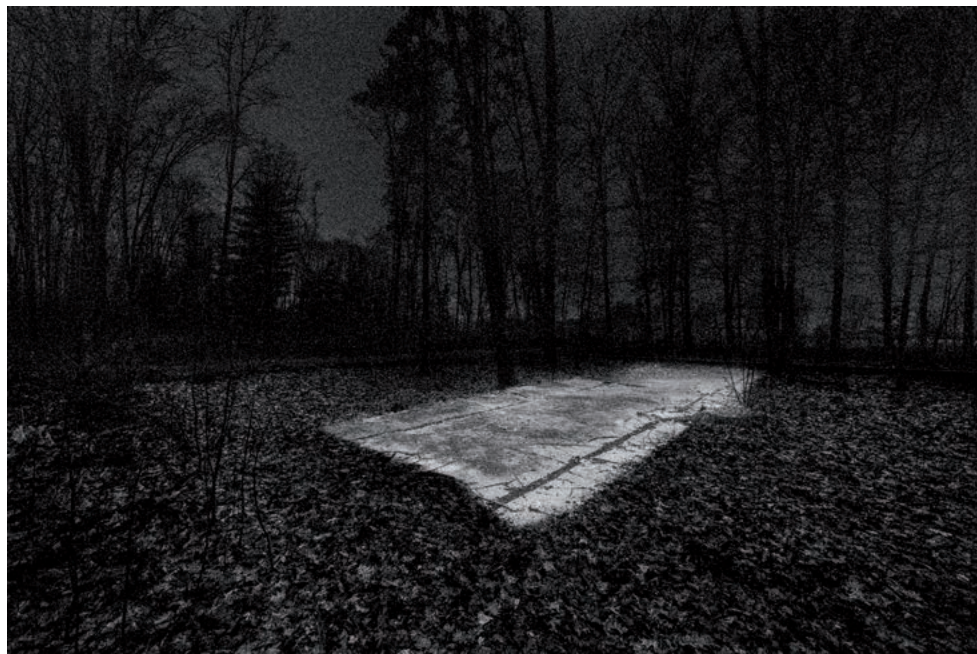
NICOLÁS COMBARRO, LA MATERIA DEL SILENCIO (CAMPO INTERNAMIENTO DE GURS)