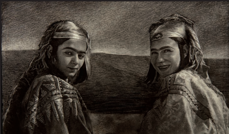
JOSÉ ORTIZ ECHAGÜE, MORAS DE TETUÁN. C. 1912