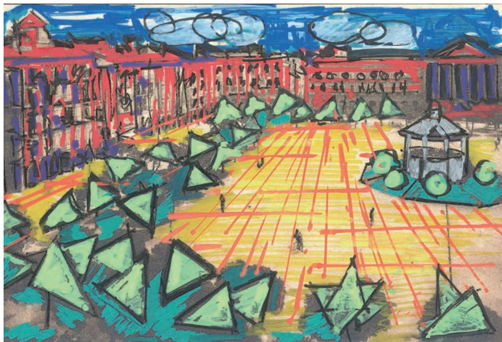
POSTAL ABSTRACTA INTERVENIDA PARA EL PROYECTO COLABORATIVO KANDINSKY EN LA PLAZA DEL CASTILLO (F. ECHARRI)