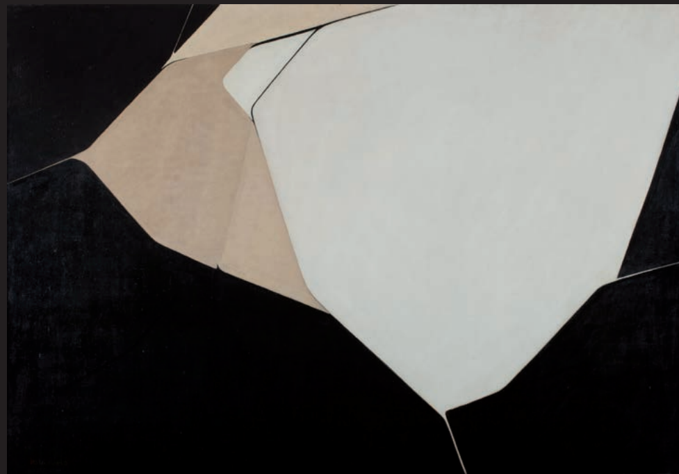
PABLO PALAZUELO, OMPHALE 1, 1962