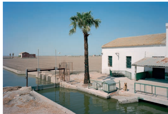
WAITING GAME III, 2021, DE TXEMA SALVANS